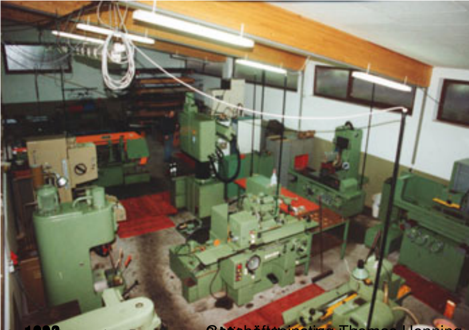
1992 Aufzucht des Bürogebäudeleiters Thomas Hennig