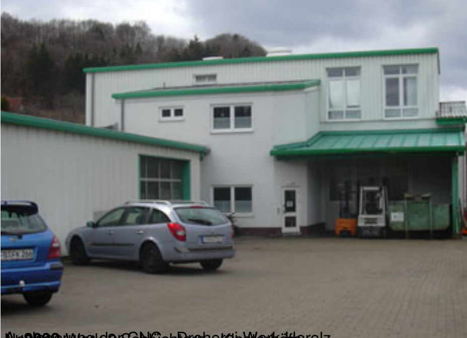
1999 Neubaue Weg der Schlichter Holzwerkstoffe